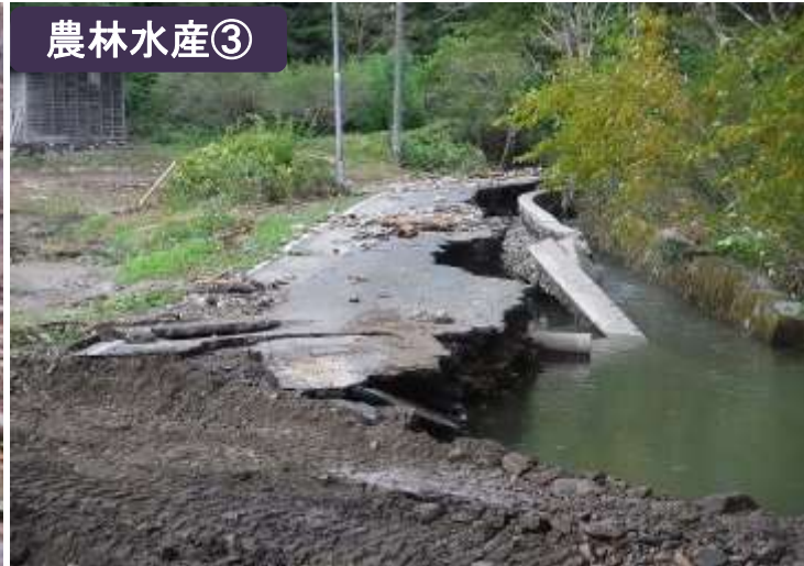
林道の路体流出（山田町）