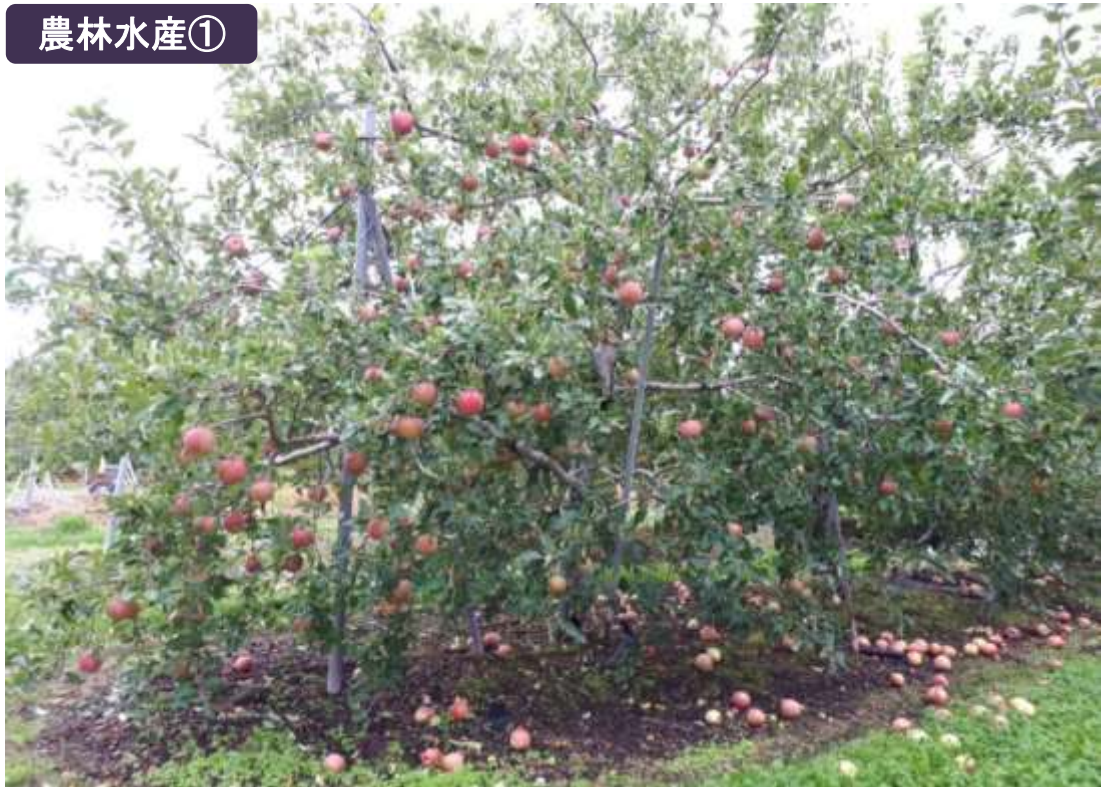
りんごの落下（北上市江釣子）