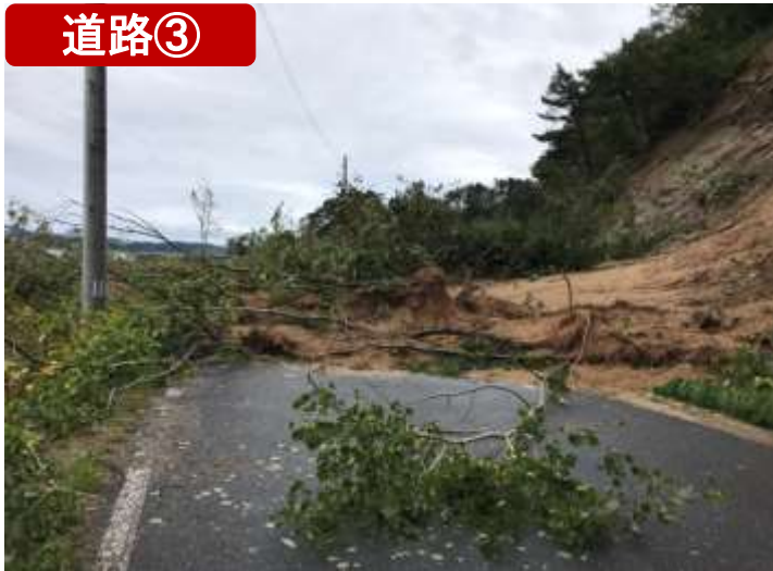
(主)重茂半島線・宮古市 (10/13)