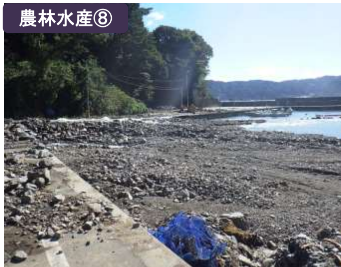
唐丹漁港泊地土砂埋塞（釜石市）