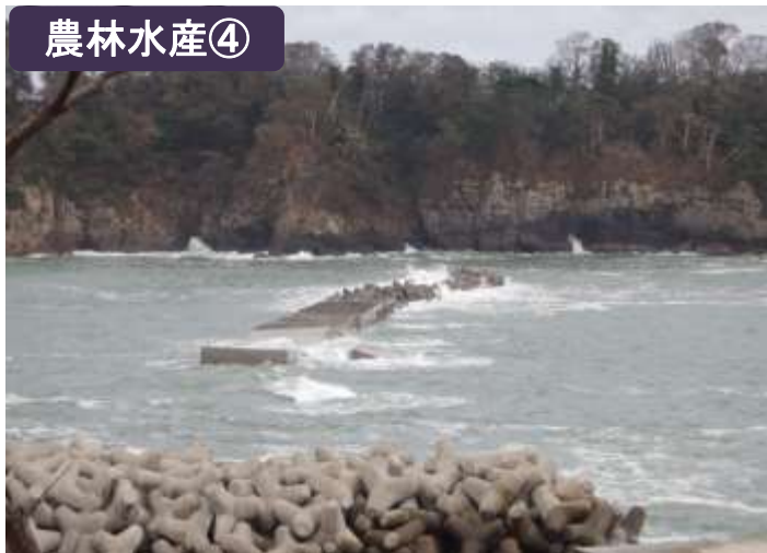
日出島地区漁場消波堤滑動（宮古市）