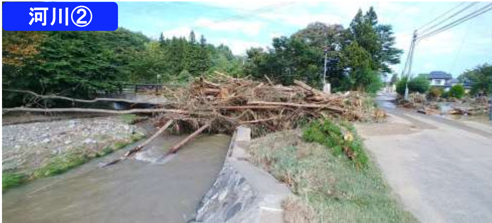
二級河川小屋畑川 久慈市長内町17地割