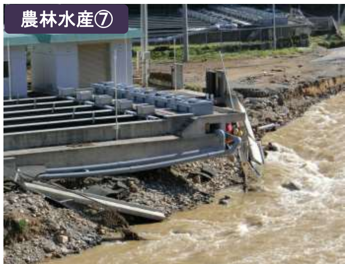
重茂漁協のサケふ化場（宮古市）