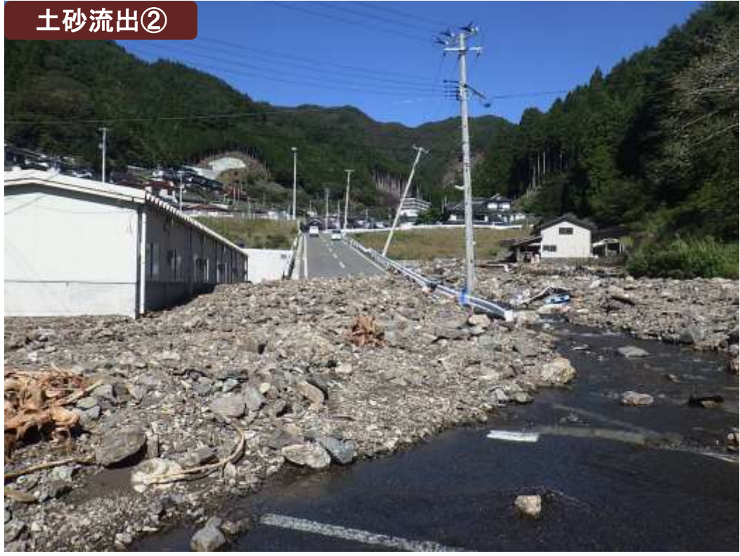
釜石市花露辺 土石流