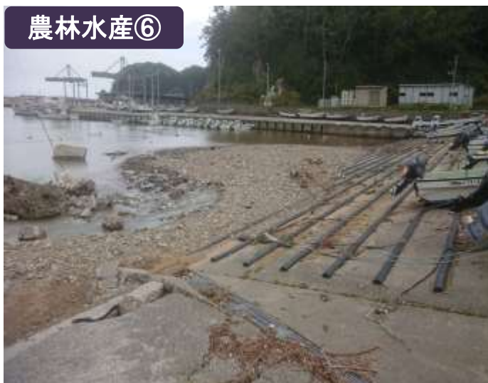
重茂漁港船揚場土砂埋塞（宮古市）