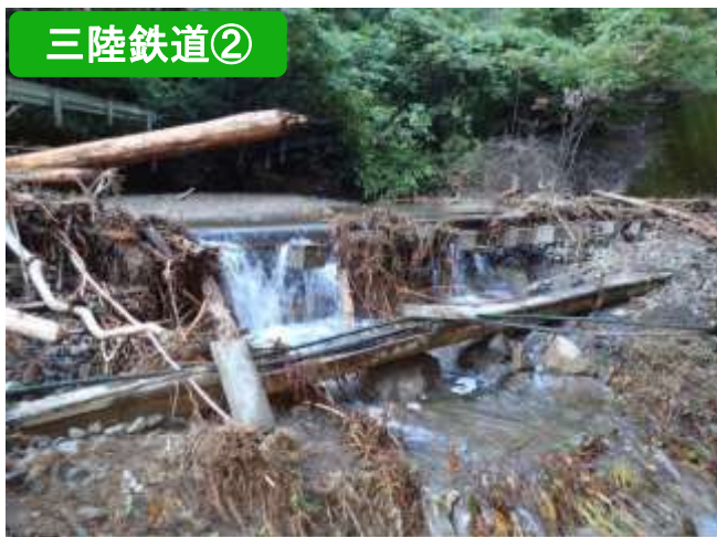
土砂流入、道床流失（普代～白井海岸）