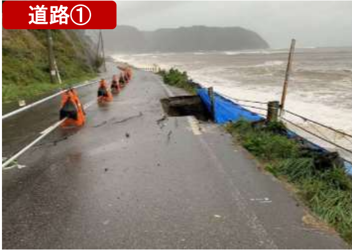
(一)野田長内線・野田村 (10/13)