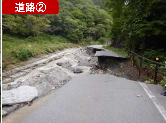
(主)岩泉平井賀普代線・田野畑村 (10/14)