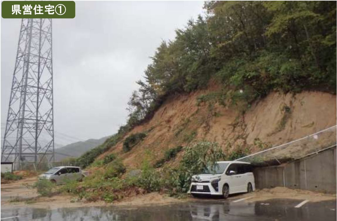
県営織笠アパート（災害公営住宅） 山田町