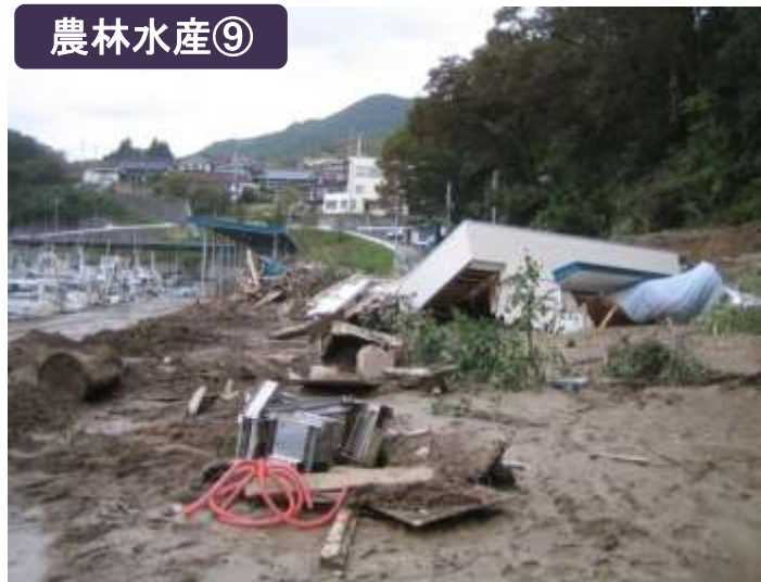
吉浜漁協根白作業保管施設（大船渡市）