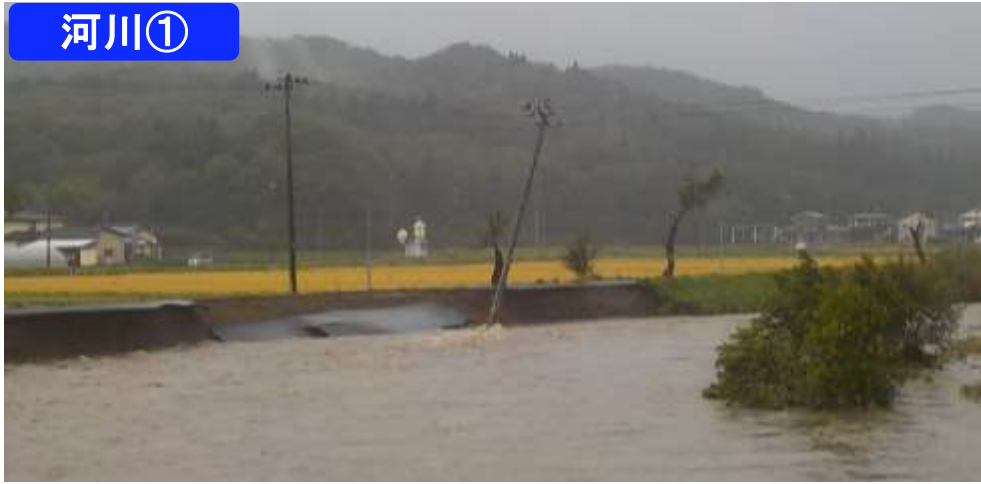
二級河川夏井川 久慈市野中橋上流右岸