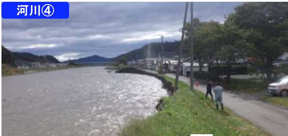
二級河川大槌川 大槌町大ヶ口地内