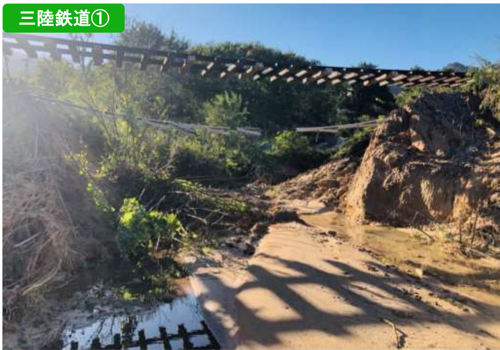
盛土消失（織笠～岩手船越）