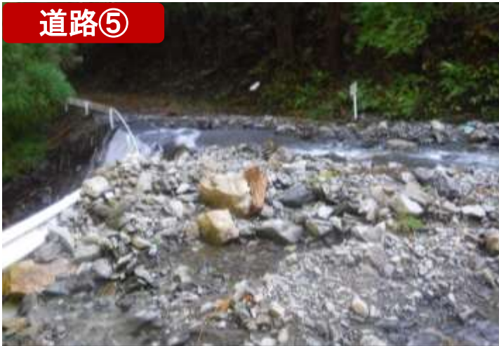
(一)桜峠平田線・釜石市 (10/13)