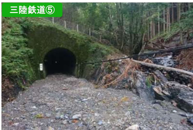
土砂流入（両石～釜石）