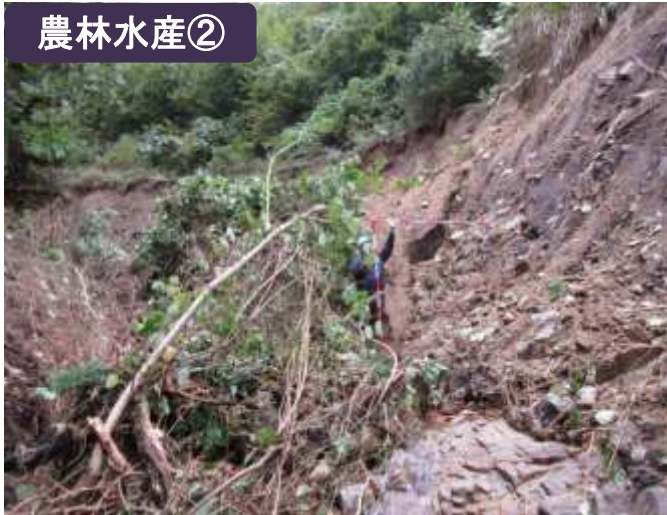
林地の山腹崩壊（普代村）