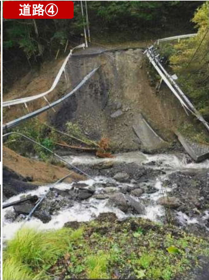
(一)水海大渡線・釜石市 (10/13)