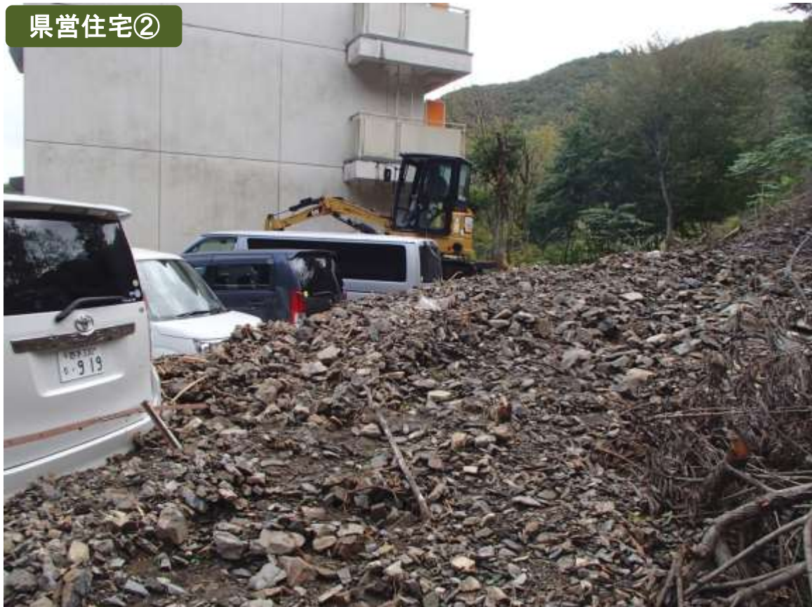
県営上平田アパート（一般公営） 釜石市