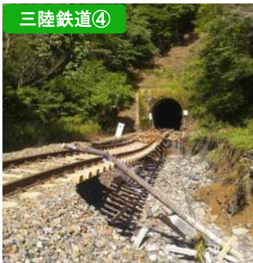
路盤・道床流出（両石～釜石）