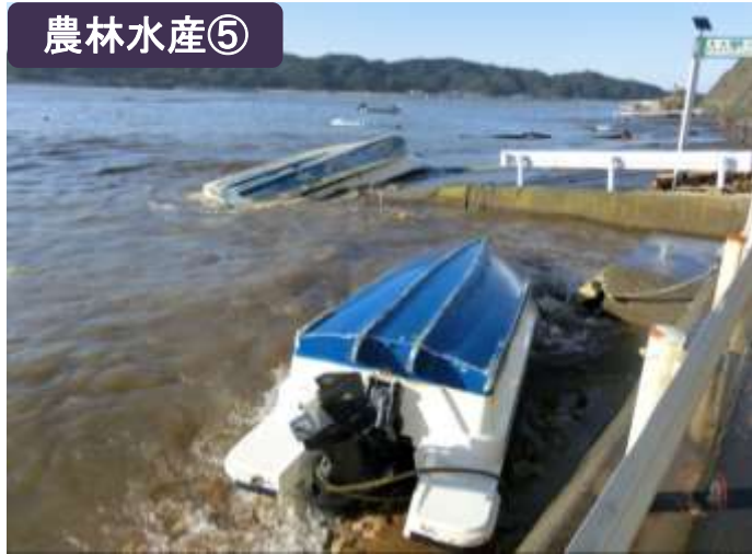
宮古漁協の漁船転覆（宮古市赤前岸壁）