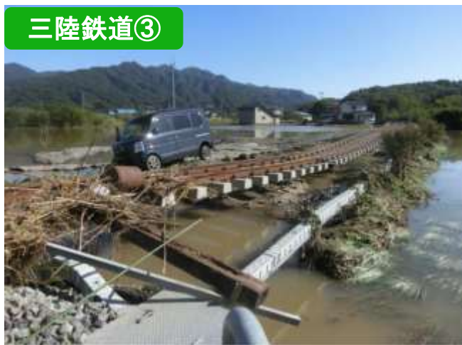
路盤・道床流出（津軽石～弘川）