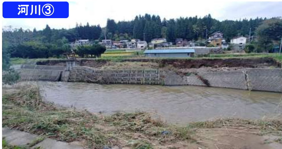
二級河川宇部川 野田村中田橋上流左岸