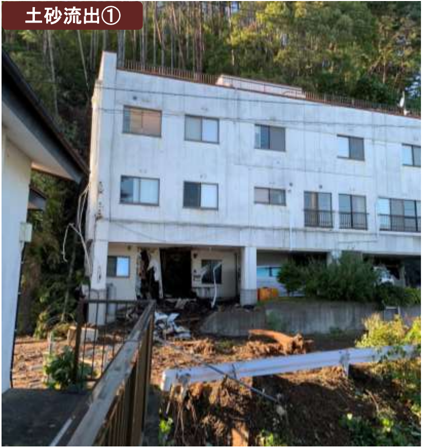
釜石市片岸 がけ崩れ