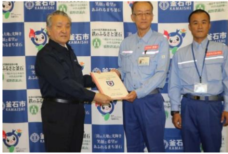
釜石市長への報告