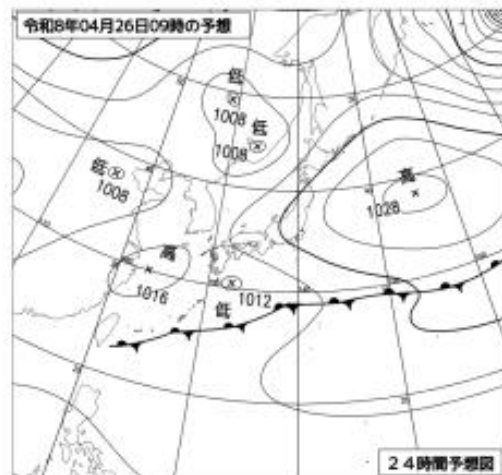
4月26日 09時の予想天気図