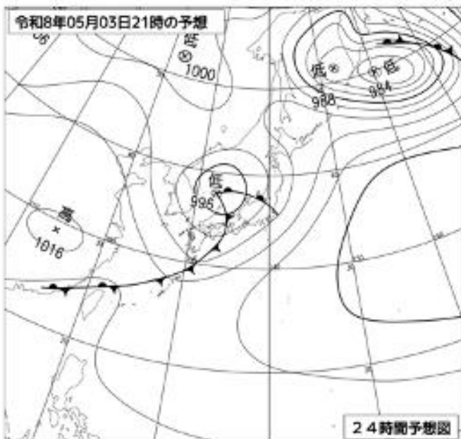
5月3日 21時 の予想天気図

3日の大槌町での最大風速は、南の風5メートルの見込みで、瞬間的に2倍程度の風が吹く場合があります。