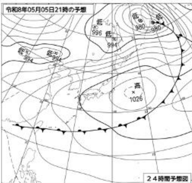
5月5日 21時 の予想天気図

5日の大槌町での最大風速は、西よりの風7メートルの見込みで、瞬間的に2倍程度の風が吹く場合があります。