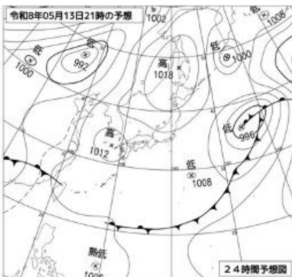
5月13日 21時 の予想天気図

13日の大槌町での最大風速は、東よりの風5メートルの見込みで、瞬間的に2倍程度の風が吹く場合があります。